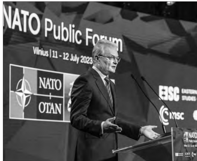
Президент Литви Гітанас Науседа.