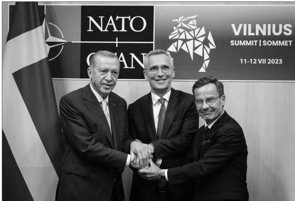
Президент Туреччини Реджеп Таїп Ердоган, генсек НАТО Єнс Столтенберг, Прем'єр-міністр Швеції Ульф Крістерссон.

На момент верстки номера ще не було достеменно відомо, які саме рішення стосовно членства України ухвалить лідери країн — членів НАТО, за винятком одного: держави Альянсу дійшли згоди і вирішили скасувати для України вимогу виконувати План дій щодо членства на її шляху до НАТО. Про це повідомив спочатку міністр закордонних справ Дмитро Кулеба, а потім його слова підтвердив Президент Литви Гітанас Науседа.