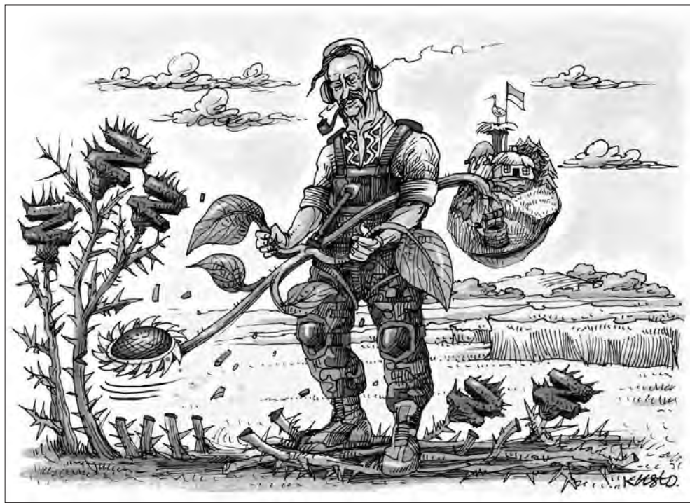
Козак на полюванні.